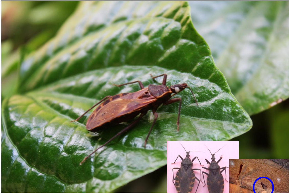
มวนเพชฌฆาต

มวนเพชฌฆาตเป็นแมลงอีกตัวหนึ่งที่ชอบเข้ามาทำรังและหลบซ่อนตัวอยู่ในบ้านเรือน จากนั้นจะออกมาดูดกินเลือดเราในตอนกลางคืนเวลาที่เรานอนหลับโดยใช้ปากที่มีลักษณะเป็นแทงแทงเข้าสู่ผิวหนังโดยเฉพาะบริเวณใบหน้าแล้วทิ้งรอยฝันแดงไว้ ซึ่งต่อมาจะเกิดเป็นผื่นแพ้รวมทั้งพิษของมวนเพชฌฆาตบางชนิดมีสารพิษทำให้เกิดความเจ็บปวดและทำให้เกิดแผล